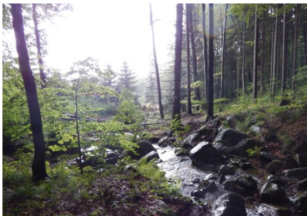
Koryto Fojtky nad územím se zástavbou

Místo, kde vtéká tok Fojtka do rozptýlené zástavby katastru Fojtky.