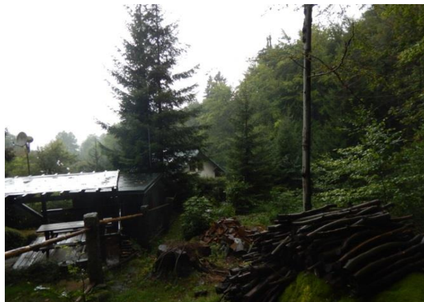
Rozptýlená zástavba na začátku Fojtky.